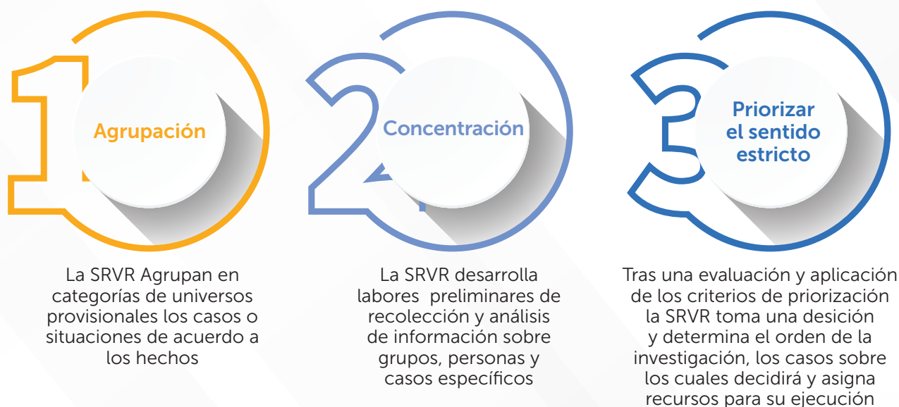
Tabla 1 - Fases de priorización en la Sala de Reconocimiento de Verdad y Responsabilidad

La anterior gráfica fue diseñada con base en el Manual sobre Criterios y Metodología de Priorización de Casos y Situaciones en la Sala de Reconocimiento de Verdad, de Responsabilidad y de Determinación de los Hechos y Conductas. Jurisdicción Especial para la Paz (2018).